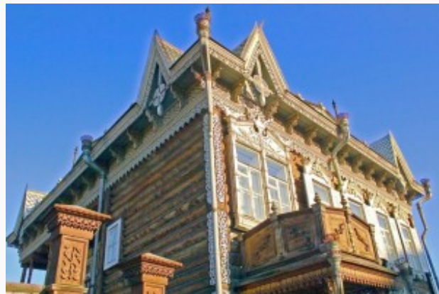
Transiberiana, casa Irkutsk

La Transiberiana è lunga 9.288 Km, per cui è la ferrovia più lunga al mondo, attraversa 2 continenti, l'Europa (1.777 Km) e l'Asia (7.512 Km), appartenendo quindi per il 19,1% all'Europa e l'80.9% all'Asia e lungo il suo tragitto passa lungo il lago Baikal, il più profondo lago al mondo con i suoi 1.637 metri e la più grande riserva d'acqua dolce del pianeta. I fiumi attraversati dalla Transiberiana sono ben 16, 88 le grandi e medie città che incrocia sul suo percorso, di cui 5 con una popolazione superiore al milione di abitanti, 9 con popolazione compresa tra 300 mila e il milione di abitanti, mentre le restanti 74 contano meno di 300 mila. Il punto più alto sul livello del mare è il passo di Yablonovy con i suoi 1.040 metri e il ponte più lungo attraversato dalla Transiberiana (2.568 metri, 18 campate da 127 metri ) fu costruito nel 1913 per oltrepassare il fiume Amur. Nel 1991 questo ponte venne demolito per costruirne uno di 2.612 metri adatto a far passare contemporaneamente treni ed automobili. Dal punto di vista climatico, le località più fredde toccate dalla Transiberiana sono tra Mogocho e Skovorodino, dove si sono registrate temperature record di ben -62 gradi. La galleria più lunga della Transiberiana si trova sotto il fiume Amur con una lunghezza di 7 Km. Man mano che si viaggia in Transiberiana cambia il fuso orario, ben 7 volte.