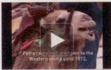
Alla volta di Petra Vota e commenta questo video

I giorni passano lievi, fino all'incontro magico con Petra, l'antica capitale dei nabatei, un vero gioiello archeologico, storico e architettonico protetto dall'UNESCO. L'area archeologica misura 25 km e ogni pietra è un monumento. Un sentiero stretto e tortuoso chiamato Siq ci conduce nel cuore della città. Ammiriamo via via gli spettacolari monumenti: la Tomba dell'Obelisco, il luogo dei sacrifici Al-Madras, il Khazneh (Tesoro), l'Anfiteatro, le Tombe Reali, il Mausoleo di Sesto Fiorentino, la Strada colonnata, un mercato, un ninfeo, un bagno nabateo, il Temenos, il tempio meridionale, il Qasr-al-Bint Firaun (o Castello della figlia del faraone), il Tempio dei Leoni alati, la Chiesa bizantina e il massiccio delle prigioni (Al-Habis), con il suo museo.