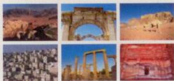
Viaggio in Giordania

Tutti i viaggi ti lasciano qualcosa, ma ce ne sono alcuni speciali, che ricordi con tenera malinconia e ti entrano per sempre nella pelle e nel cuore. Il nostro viaggio in Giordania è uno di questi. Si comincia con la capitale Amman, dove si resta affascinati dall'incantevole Moschea di re Abdullah, una costruzione inconfondibile con una grande cupola blu. Ci si dirige poi alla volta della splendida città romana di Jerash, già abitata nel neolitico, ma fiorita intorno al 332 a.C., sotto Alessandro Magno. Dopo questo primo appagante assaggio partiamo in direzione di Madaba, nota soprattutto per i mosaici bizantini, fra cui la famosa mappa della Palestina (VI secolo), dove si scorgono ancora oggi il Nilo, il Mar Morto e la pianta di Gerusalemme, con la posizione del Santo Sepolcro. Una volta lasciata Madaba saliamo sul Monte Nebo, da dove Mosè scorse la Terra promessa (si dice che la sua tomba sia qui), per poi proseguire verso la Riserva Naturale di Dana, istituita da poco con lo scopo di promuovere il turismo ecologico.