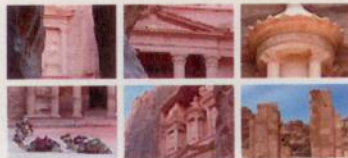
Petra, la città rosa