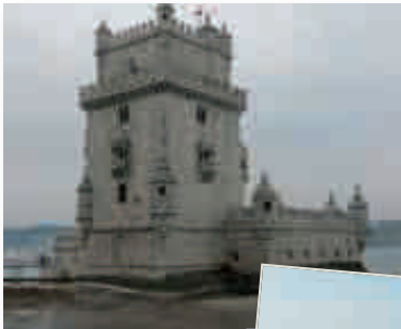
La torre di Belem, costruita per proteggere l'ingresso del porto di Lisbona.

Un fine settimana "ai confini della terra"