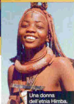
Una donna dell'etnia Himba.