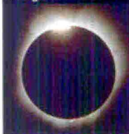
Eclissi di sole: si vedrà benissimo dalla Mongolia.

L'eclissi totale di sole è una rarità (quest'anno cade il 1° agosto) e ti fa vedere le stelle in pieno giorno. Ecco perché gli appassionati del cielo si danno appuntamento sui monti Altai, da dove l'evento sarà perfettamente visibile. L'Unione astrofili italiani organizza un' esplorazione dal 28/7 al 7/8 (€2.785) con I viaggi nel marsupio. Info www.marsupioviaggi.com