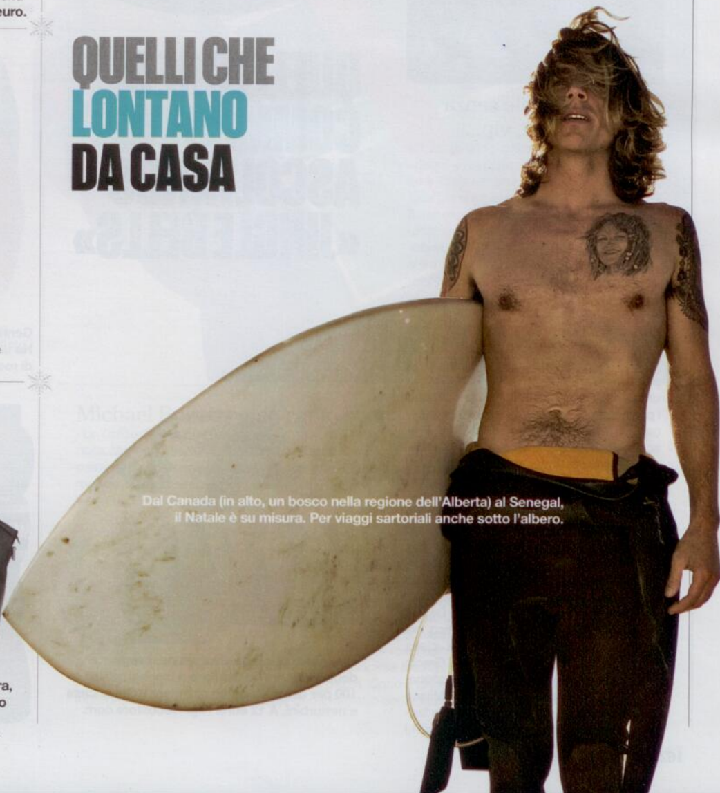
Dal Canada (in alto, un bosco nella regione dell'Alberta) al Senegal, il Natale è su misura. Per viaggi sartoriali anche sotto l'albero.

...na Octo travel bag Boston la borsa... in vitello moka con tracolla, cerniera, logo in rutenio. Per un lungo viaggio o una fuga di un weekend. A 1.800 euro.