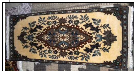
TAPPETO No. 1