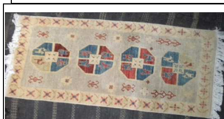
TAPPETO No. 13