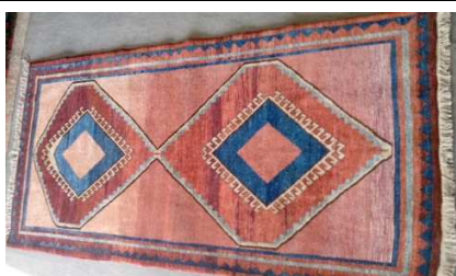
TAPPETO No. 19