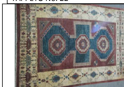
TAPPETO No. 22