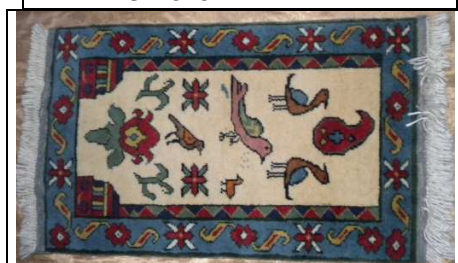
TAPPETO No. 6