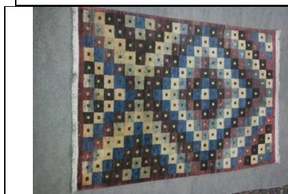
TAPPETO No. 26