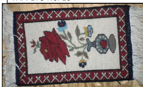
TAPPETO No. 10