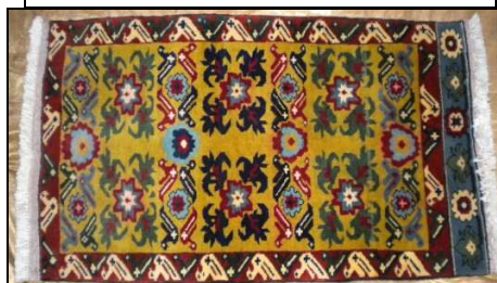
TAPPETO No. 5