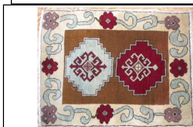
TAPPETO No. 15