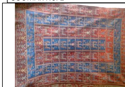
SOUMAK No. 2