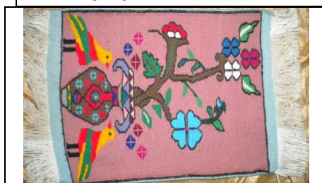
TAPPETO No. 11