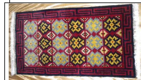
TAPPETO No. 3