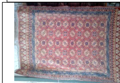
SOUMAK No. 1