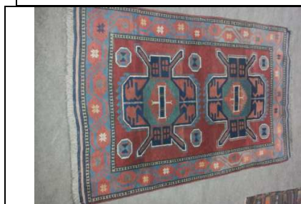
TAPPETO No. 25