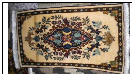
TAPPETO No. 2