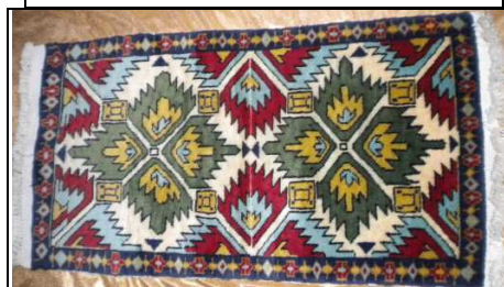
TAPPETO No. 8