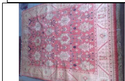
TAPPETO No. 21