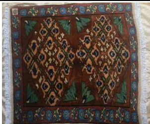
TAPPETO No. 17