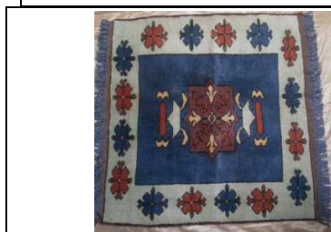
TAPPETO No. 16