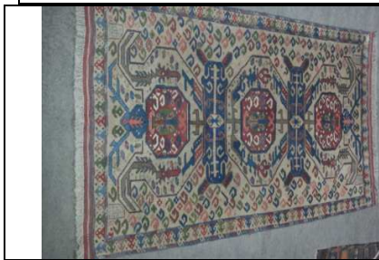
TAPPETO No. 27