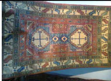
TAPPETO No. 20