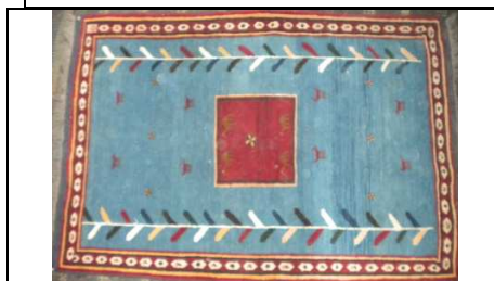
TAPPETO No. 12