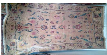
TAPPETO No. 18