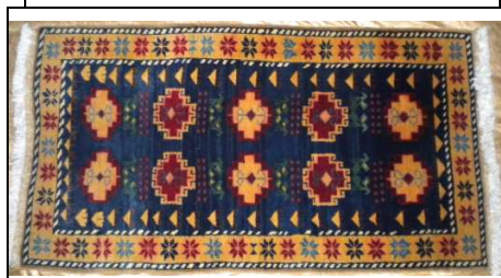
TAPPETO No. 7