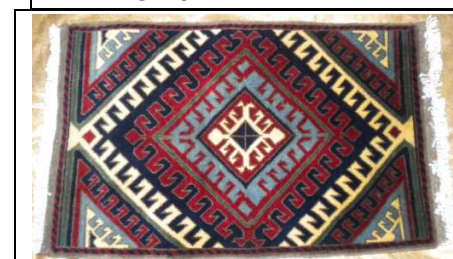
TAPPETO No. 4