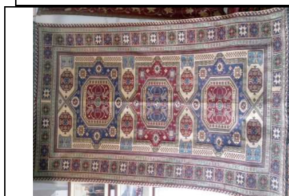
TAPPETO No. 23