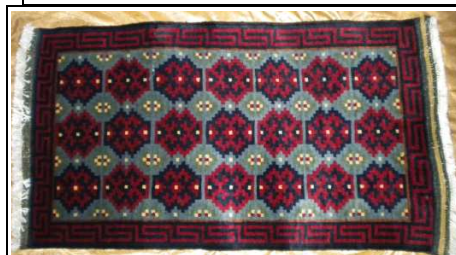
TAPPETO No. 9